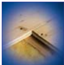
Saubere, schnelle Verlegung