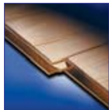
... für langlebige Produkte

Die bessere Alternative ... schnell, flexibel, wirtschaftlich und ökologisch!